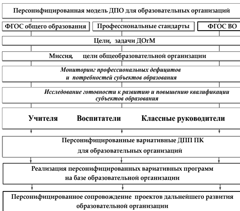
Рис. Модель персонифицированного ДПО для образовательных организаций