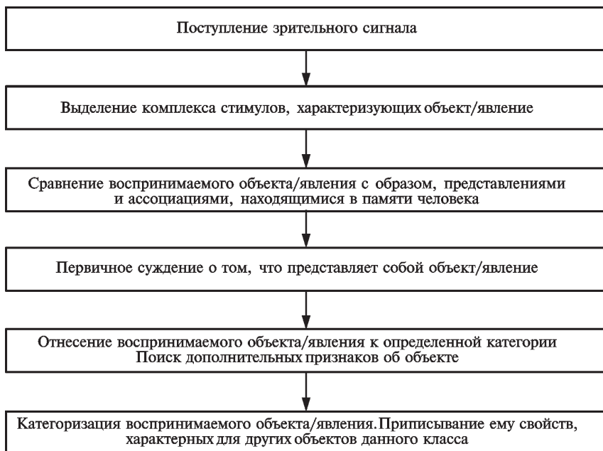
Рис. 1. Механизм зрительного восприятия информации

аудиовизуального текста, то здесь имеют место два параллельных процесса — синхронные зрительное и слуховое восприятия текста реципиентом, одновременно протекающие механизмы которых отражены на рис. 1 и 2.