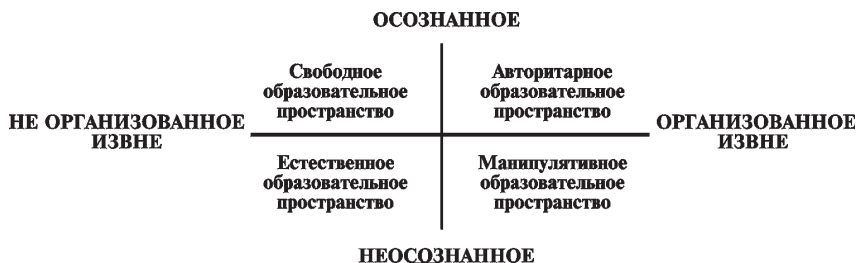
Рис. 2. Классификация образовательных пространств

ходимых педагогу, в манипулятивном — с созданием условий становления и развития человека, в свободном — с поддержкой и сопровождением образующегося в достижении его собственных целей.