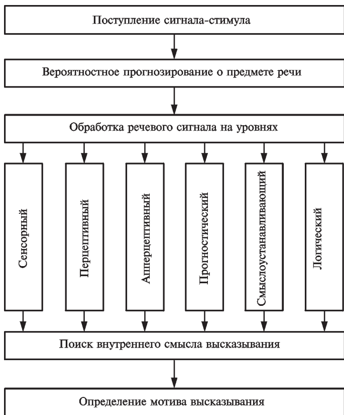
Рис. 2. Механизм слухового восприятия информации

ко-грамматических и слухо-произносительных) навыков, четкого осознания направленности умственной деятельности на решение конкретной задачи, сформулированной перед началом работы с тем или иным видом текста, и др. При этом в соответствии с установкой прием информации текста должен провоцировать ее оценку реципиентом, которая часто является эмоционально-субъективной. Как правило, во многом данная оценка зависит от тех образов и впечатлений, которые вызывает рецепция текста — зрительных, слуховых и других образов.